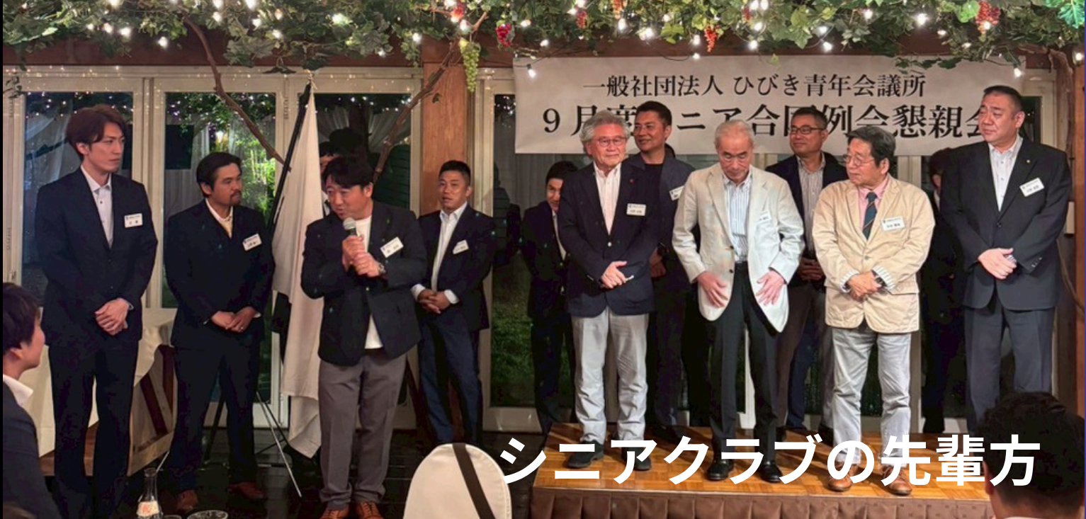
シニアクラブの先輩方